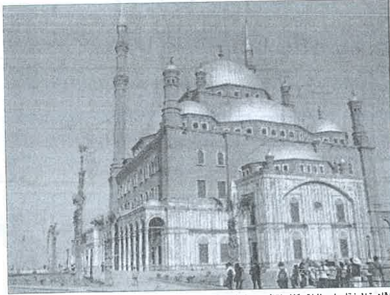
■ قاهرة المعز تاريخ ومزارات وكثر ينتظر من يكتشفه

على تلك المدن واجهتها رغم إمكانية استضافتها للسائحين لكنها مطالبة بالتحرك العاجل لوضع خطة تطوير محكمة لبنيتها السياحية.. وفى مقدمتها توفير وسائل نقل حديثة وذكية.. وتطوير ما هو موجود من تلك الوسائل.. وتطوير الطرق وجعلها أكثر إنسيابية.. بجانب توفير أعلى اساليب الضيافة للسياح وتوفير وسائل الترفيه المطلوبة.. هكذا نتأكد مما قلت من القلق.