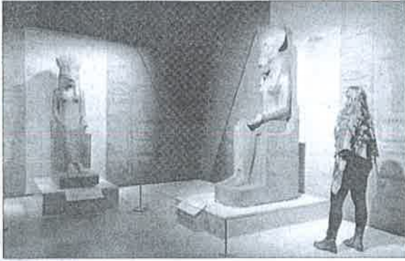
إحدى الزائرات أثناء مشاهدتها ملكات مصر