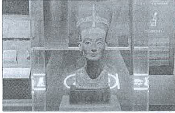
إحدى ملكات مصر داخل المعرض

في واحدة من أكبر الفاعليات الدولية. اقامت المؤسسة الدولية ناشيونال جيوغرافيك معرض «ملكات مصر» في المعصور الفرعونية وذلك تقديرا لدور المرأة المصرية القديمة في بناء الحضارات القديمة والترويج للسياحة والثقافة المصرية داخل الولايات المتحدة الأمريكية.