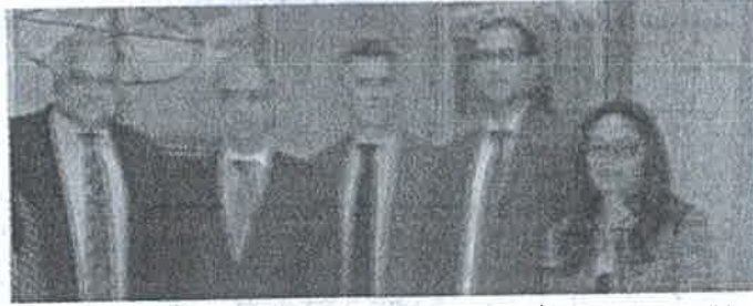
بعثة صندوق النقد الدولي