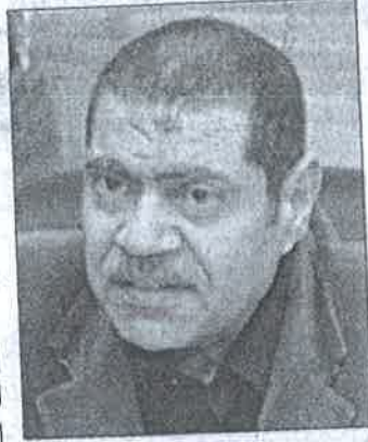
■ سراج الدين سعد

أكد سراج الدين سعد، مساعد وزيرة السياحة لشئون المتابعة، والرئيس التنفيذي لهيئة التنمية السياحية، أن الهيئة حققت إيرادات تخطت حاجز ٩٠٠ مليون جنيه خلال ٩ شهور من العام المالي ٢٠١٩ / ٢٠١٨، من إجمالي المخطط المالي المستهدف والبالغ قدره ١,٦ مليار جنيه. وصرح رئيس هيئة التنمية السياحية، إن الهيئة حققت مبلغاً قدره ٧٦٠ مليون جنيه من الفائض الحكومي المستهدف للعام المالي ٢٠١٩ / ٢٠١٨ والبالغ قدره ١,١ مليار جنيه. وتابع الرئيس التنفيذي لهيئة التنمية السياحية، قائلاً: إن الإيرادات التي تم تحقيقها خلال ٩ شهور من العام المالي جاءت نتيجة تنفيذ تطبيق سياسة تحريك الالتزامات المالية مع العملاء بهدف تحصيل أموال الدولة، بدون أي تخصيصات جديدة للأراضي السياحية.