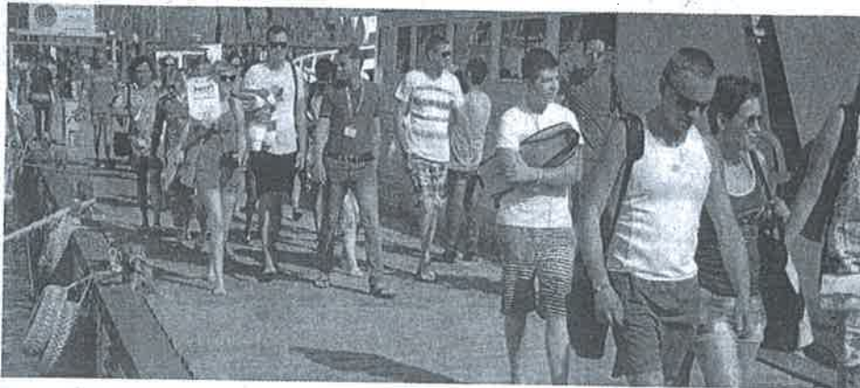
شرم.. جاهزة لعودة الروس