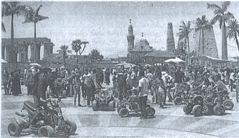
ونسب إشغال الحدائق والمتنزهات كاملة العدد في عيد «شم النسيم»