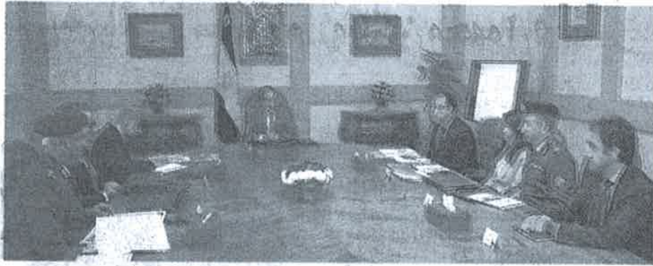
الرئيس خلال اجتماعه مع الحكومة لبحث المشروعات السياحية وتطوير المناطق الأثرية

كما أوضح وزير الاتصالات أن تطوير خدمات الاتصالات المقدمة للمواطنين يعد أحد أهم أولويات إستراتيجية قطاع الاتصالات وتكنولوجيا المعلومات، منوهاً إلى وضع إطار تنظيمى يضمن تقديم خدمات متطورة ومتميزة للمواطنين، ويحافظ على حقوق الدولة والشركات.