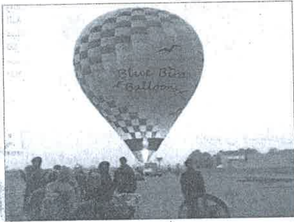
■ مجموعة من السياح ينتظرون رحلتهم