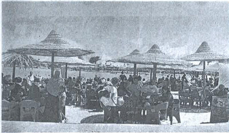
انتعاش حركة السياحة في أعياد شم النسيم «صورة أرشيفية»

توقعات بوصول الإشغال في «العين السخنة والساحل» إلى ٩٢٪.. وشم الشيخ والغردقة ٧٠٪